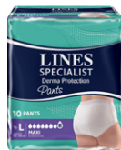
LINES SPECIALIST DERMA PROTECTION