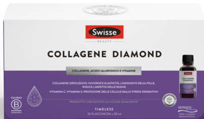
SWISSE COLLAGENE DIAMOND 10 flaconcini x 30 ml

CONTINUA LA PROMOZIONE DI MARZO VALIDA FINO AL 30 APRILE 2025