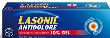
LASONIL ANTIDOLORE 10% gel tubo da 120 g