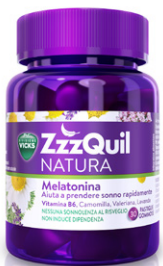
VICKS ZZZQUIL NATURA 30 pastiglie gommose