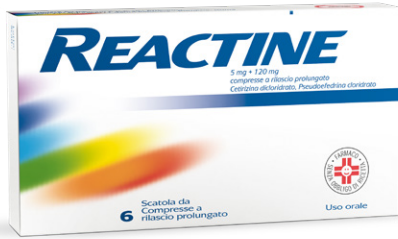
REACTINE 5 mg + 120 mg 6 compresse a rilascio prolungato