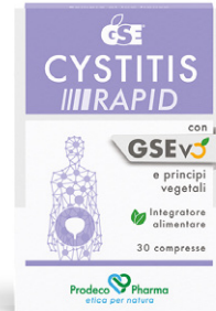
GSE CYSTITIS RAPID 30 compresse