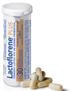
LACTOFLORENE PLUS 30 capsule

IL TUO FARMACISTA AL TUO FIANCO, PER ASCOLTARTI SEMPRE.