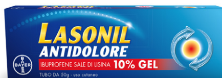
LASONIL ANTIDOLORE 10% gel tubo da 50 g