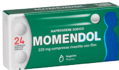
MOMENDOL 220 mg 24 compresse rivestite