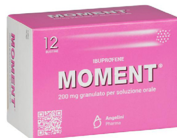
MOMENT 200 mg GRANULATO PER SOLUZIONE ORALE 12 bustine