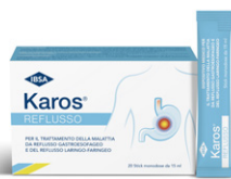
KAROS REFLUSSO 20 stick monodose da 15 ml