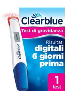
CLEARBLUE TEST DI GRAVIDANZA