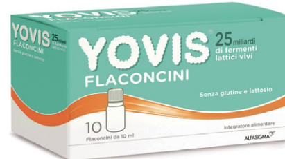
YOVIS FLACONCINI 10 flaconcini da 10 ml