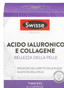
SWISSE ACIDO IALURONICO E COLLAGENE Bellezza della pelle 30 compresse