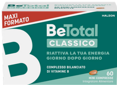
BETOTAL CLASSICO 60 mini compresse