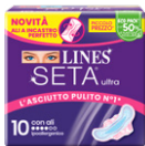
LINES SETA ULTRA