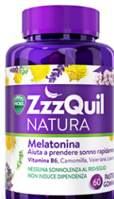
VICKS ZZZQUIL NATURA 60 pastiglie gommose