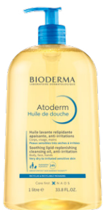
ATODERM HUILE DE DOUCHE 1 L