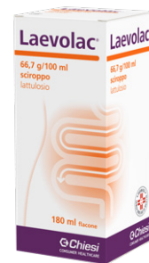
LAEVLAC 66,7 g/100 ml SCIROPPO Fiacone 180 ml