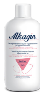
ALKAGIN DETERGENTE INTIMO LENITIVO 400 ml