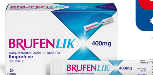
BRUFENLIK 400 mg 20 bustine da 10 ml