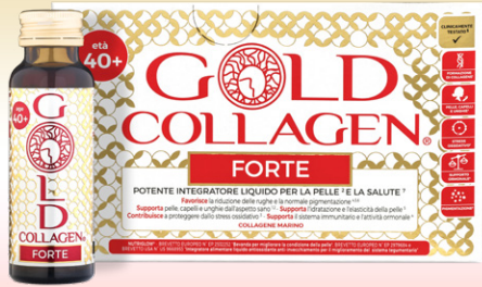
GOLD COLLAGEN FORTE 10 flaconi