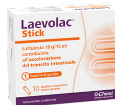
LAEVLAC STICK 10 bustine monodose