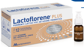
LACTOFLORENE PLUS 12 flaconcini

È un medicinale senza obbligo di prescrizione (SOP) che può essere consegnato solo dal farmacista. Ascolta il tuo Farmacista.